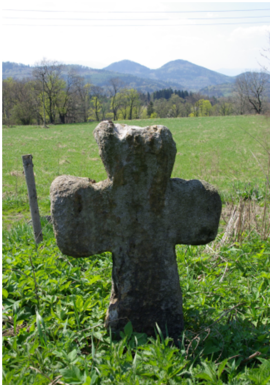
7. Miedzianka – kamienny krzyż przy dawnej drodze do Janowic Wielkich (stan: 2011 r.), fot. D. Wojtucki.