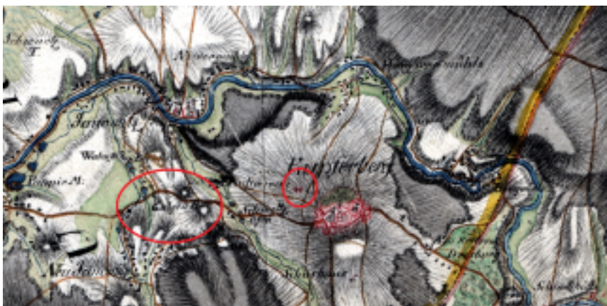
5. Kamienne krzyże i dawna Góra Szubieniczna na mapie rękopiśmiennej Ludwiga Reglera.