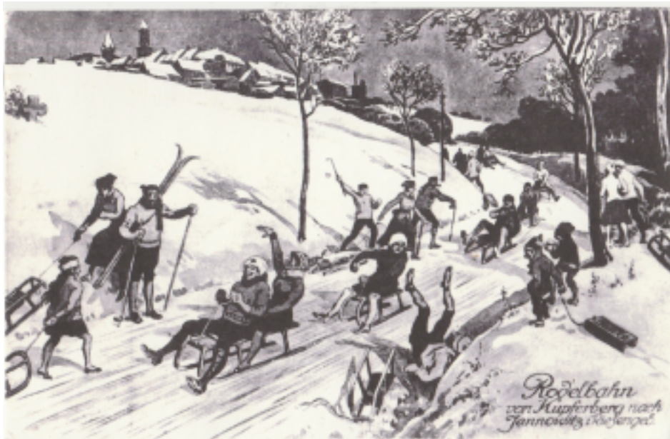
1. Miedzianka – w tle kamienny krzyż z napisem: Memento . Pocztówka ze zbiorów Haralda Quietzscha.

Miedzianka, dawniej Kupferberg , to dziś niemal wymarła miejscowość. Kiedyś tętniący życiem górniczy ośrodek. Przypomina o tym widoczne jeszcze rozplanowanie Rynku, gdzie w przeszłości zapewne w centralnym punkcie, stał drewniany lub kamienny pręgierz. Za jedyny zabytek wiązany z prawodawstwem, a zachowanym do dziś należy uznać kamienny krzyż z osobliwym i wymownym napisem Memento . Niestety w mrokach dziejów zaginął prawdziwy powód wystawienia tego obiektu i nie sposób stwierdzić, czy słusznie zabytek ten wiązany jest z dawnym prawem. Obecnie znajduje się on w polu, przy dawnej drodze z Miedzianki do Janowic Wielkich (niem. Jannowitz ). Naj-