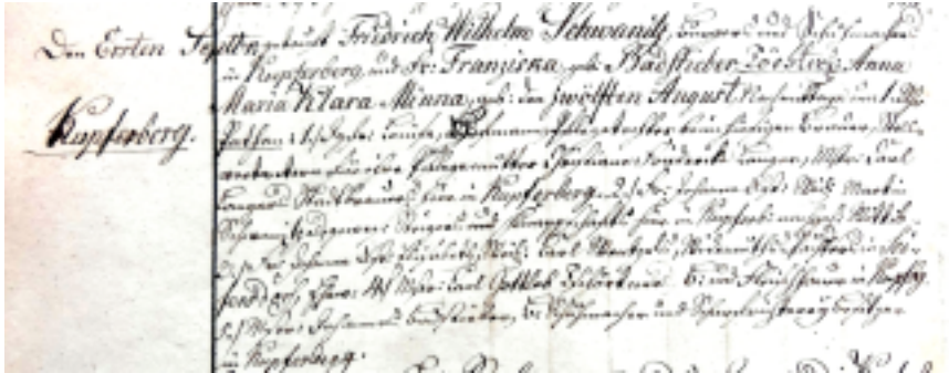
11. Zapis w księdze chrztów z września 1833 r., w którym jako ojciec chrzestny uczestniczył właściciel miejscowej katowni.

ka jednego z mieszczan, tytułując się przy tym mieszczaninem, szewcem i właścicielem miejscowej katowni 18 .