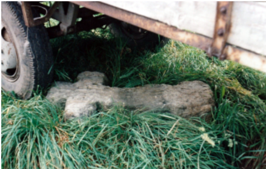
4. Miedzianka – kamienny krzyż prowizorycznie zabezpieczony przed próbą kradzieży (stan: sierpień 1999 r.), fot. D. Wojtucki.