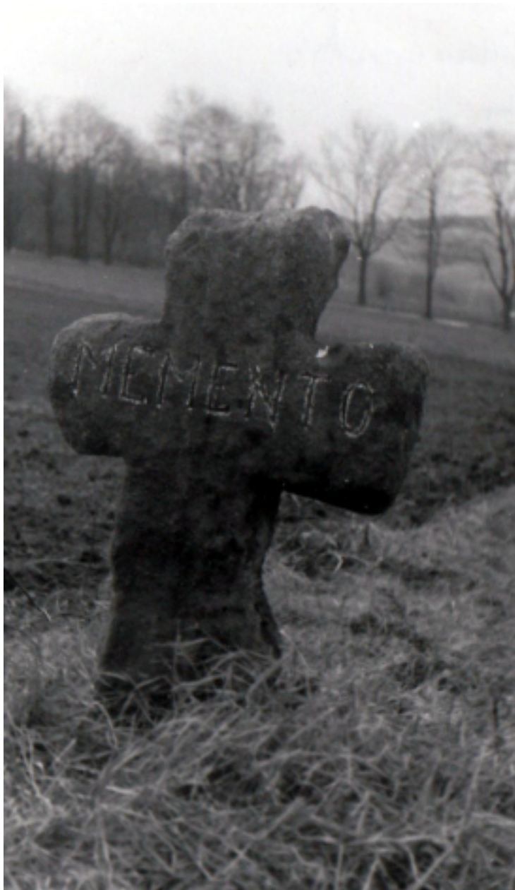
3. Miedzianka – kamienny krzyż na początku lat 80-tych XX wieku, fot. L. Majchrzak.