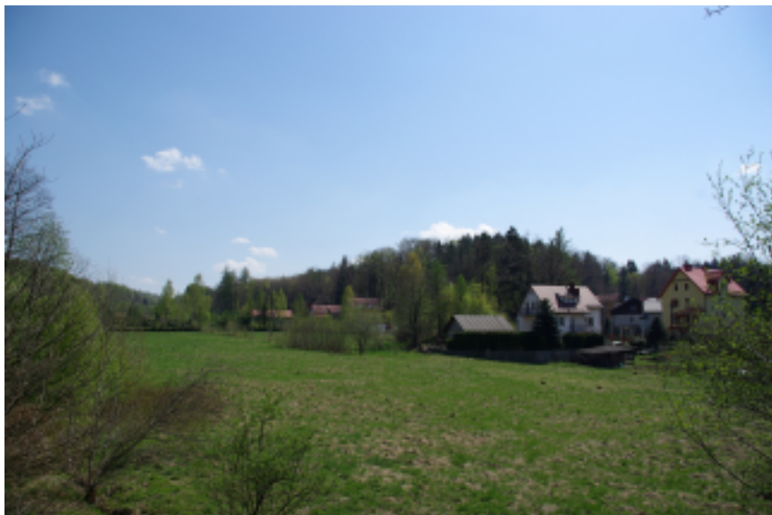
9. Miedzianka – Góra Szubieniczna widoczna z drogi do Janowic Wielkich, fot. D. Wojtucki.

spokrewniony był z Schaffgotschami poprzez ożenek z Heleną Elenonorą 11 . Nie jest to jedyny wyrok wydany dla miejscowego sądu przez Praską Izbę Apelacyjną. Dnia 5 września 1718 r. na praskim zamku orzeczono karę pracy przez okres jednego roku w kajdanach wobec dwóch kobiet 12 .