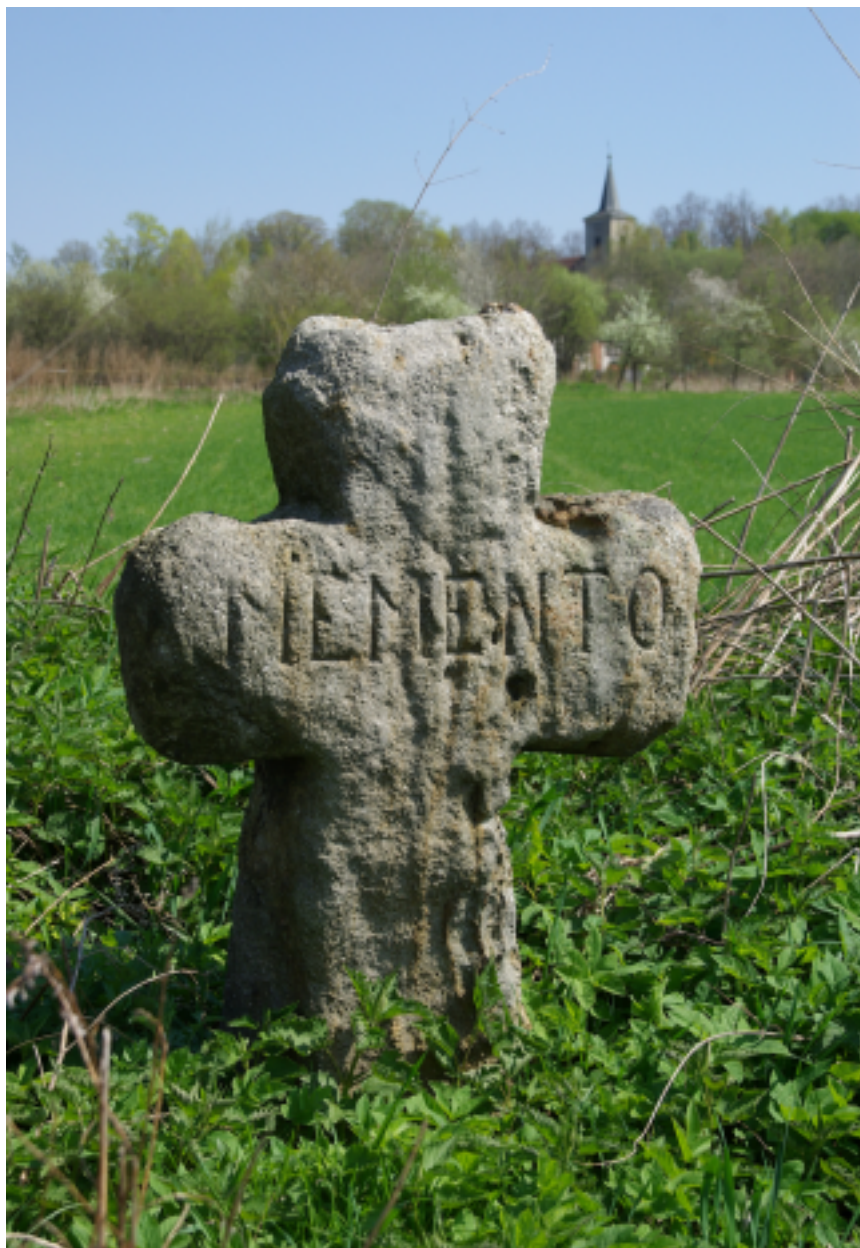
6. Miedzianka – kamienny krzyż przy dawnej drodze do Janowic Wielkich (stan: 2011 r.), fot. D. Wojtucki.