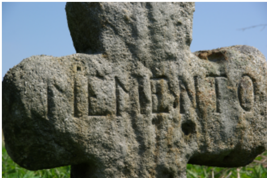
8. Memento – zbliżenie napisu zdobiącego krzyż, fot. D. Wojtucki.

Mniej więcej kilometr na zachód od miejscowości znajduje się wzniesienie noszące w przeszłości miano Góry Szubienicznej (niem. Galgenberg ), co wskazuje, że zlokalizowano na nim miejsce straceń, gdzie egzekwowano postanowienia miejscowego sądu. Również i ona znalazła się na mapie wspomnianego wyżej Reglera, kartografa Fryderyka II Wielkiego. Być może stała tutaj drewniana szubienica, chociaż nie można wykluczyć, że w latach świetności miasteczka jego władarze zdecydowali się na urządzenie bardziej monumentalne i odporne na warunki atmosferyczne, wykonane z kamienia. Niewiele wiadomo też o użytkowaniu tego miejsca straceń. Na postawie wyroków z Praskiej Izby Apelacyjnej dowiadujemy się, że dla miejscowego sądu w Miedziance ( An das Kupferberger Gericht ) zasądzono w 1713 r. wyrok śmierci, który miał zostać wykonany poprzez ścięcie mieczem na osobie Tobiasza Grundmanna 9 . Nie wiadomo jednak jakiego przestępstwa oskarżony się dopuścił, ponieważ zostało ono ujęte dość lakonicznie, jako „ciężkie zbrodnie” – schweren Verbrechen . Orzeczenie zostało wydane na zamku praskim 3 lipca tegoż roku i było adresowane do barona Johanna Georga von Fürst 10 . Tenże urodzony w 1643 r. władał tymi terenami do swojej śmierci w 1723 r. i tytułował się jako pan na Miedziance ( Herrn auf Kupferberg ). Jego syn Johann Karol