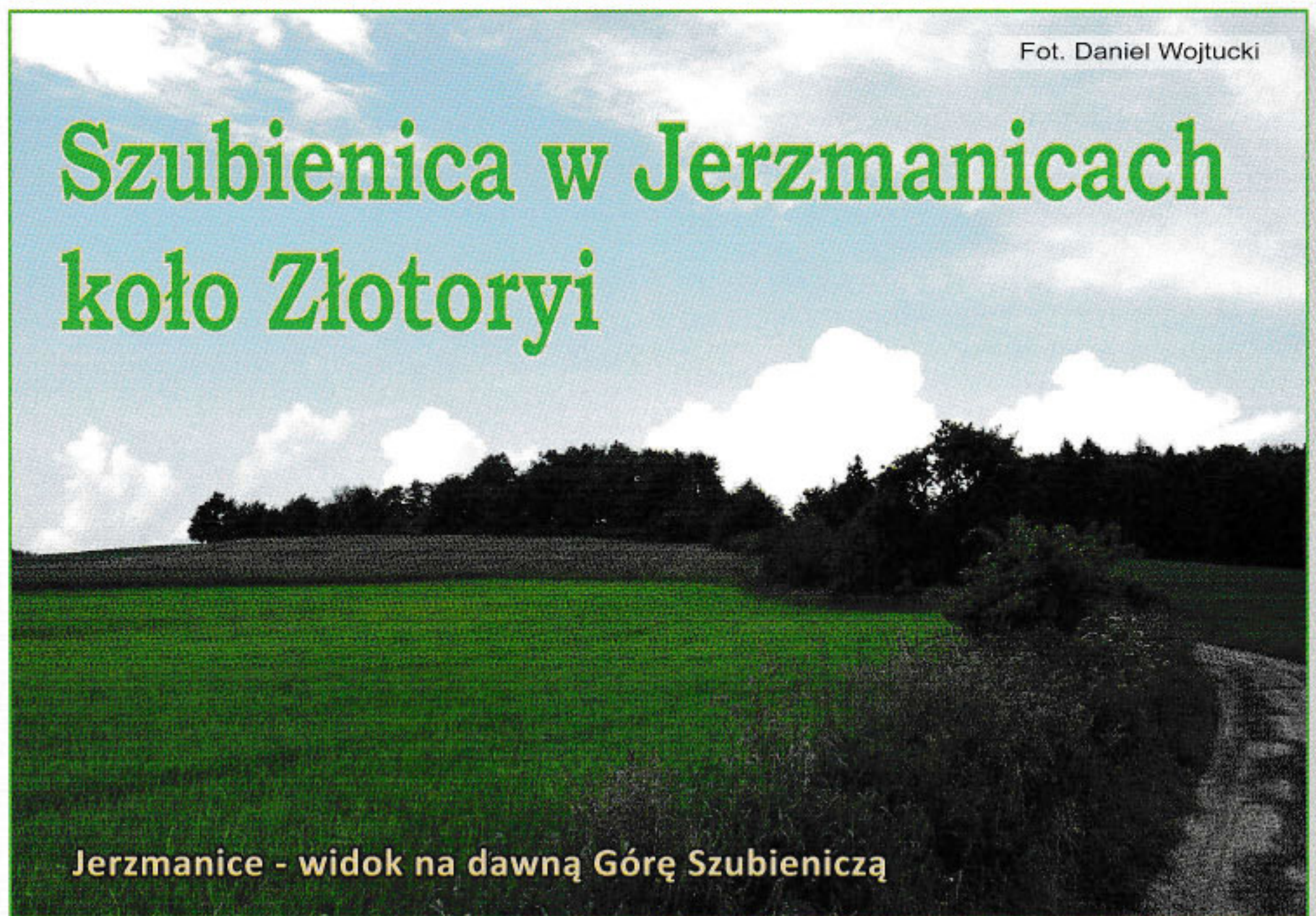
Jerzmanice - widok na dawną Górę Szubieniczą

Oprócz odkrytej podczas badań archeologicznych w lipcu 2016 r. kamiennej szubienicy w Złotorzy, niewiele osób zdaje sobie sprawę, że w okolicy istniały jeszcze inne urządzenia tego typu. W miejscowości Wojcieszyn plac straceń znajdował się przy dawnej drodze do Złotorzy. Z kolei w Proboszczowie szubienica stała na rozdrożu za wsią, w kierunku na miasteczko nad Kaczawą, znane dawniej z wydobywania złota. Obiekty te zostały zaznaczone na mapach wojskowych z połowy XVIII wieku. Niestety nie uwieczniono na nich szubienicy w Jerzmanicach, ani w pobliskiej Pielgrzymce. Do tej pory nie udało się jednak określić, gdzie znajdowało się miejsce kaźni skazańców w tej miejscowości, chociaż zachowały się informacje o wielu egzekucjach.